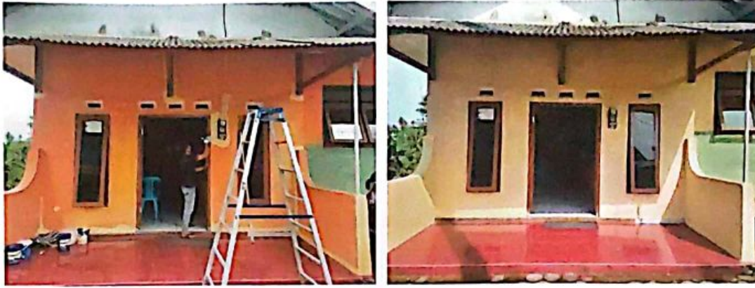
Pengecatan Kantor Desa

Dalam hal pengadministrasian desa juga menganggarkan untuk penyusunan atau pemutakhiran profil desa dengan memberikan honor kepada petugas register desa serta menganggarkan untuk pendataan SDG's Desa sebesar Rp 11.800.000,- untuk 1 tahun dan terealisasi Rp 11.800.000,- (100%).