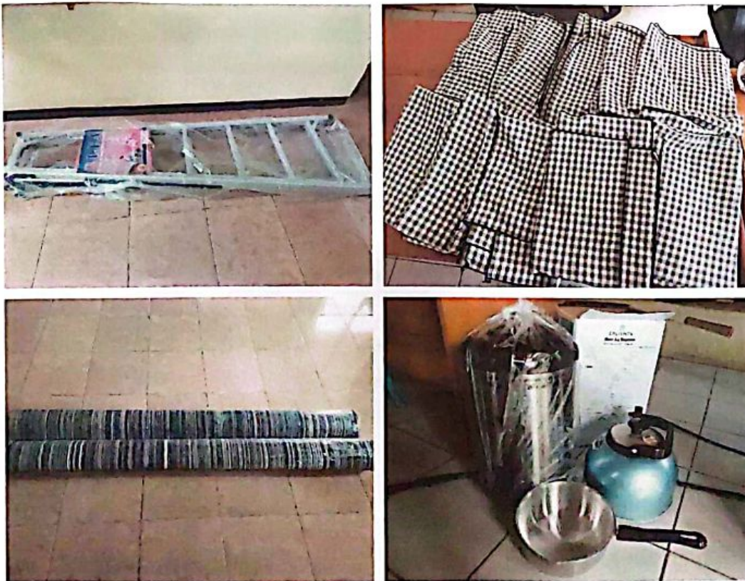
Pengadaan Aset tetap Perkantoran dan Peralatan Dapur

Sarana dan prasarana Pemerintah Desa juga harus diperhatikan, salah satunya dengan sarana yang dapat mendukung kelancaran pelaksanaan pemerintahan yang dianggarkan sebesar Rp 4.196.674,- dan terealisasi Rp 2.435.000,- (60%) karena ada barang yang tidak terbeli. Juga agar pelayanan lebih nyaman, maka dianggarkan untuk pemeliharaan gedung dan prasarana Kantor Desa seperti pengecatan Kantor Desa, servis laptop dan pemeliharaan kendaraan dinas dan mobil sampah dengan total anggaran sebesar Rp 4.180.000,- dan terealisasi Rp 3.350.000,- (100%) ada sisa anggaran dari pemeliharaan kendaraan dinas.