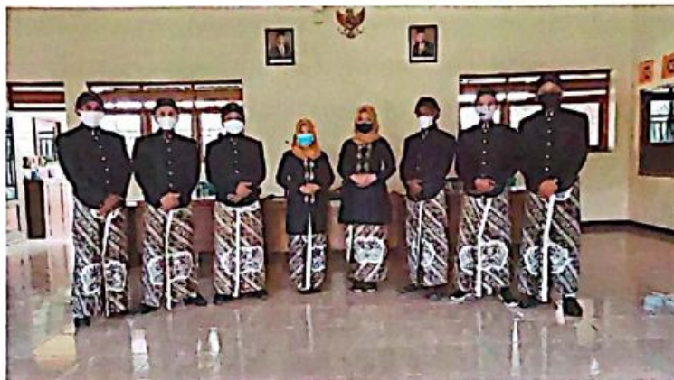
Pengadaan Pakaian Adat untuk Hari Jadi Kab. Wonosobo

Dan untuk memperingati Hari Kemerdekaan RI dan juga Hari Jadi Kabupaten Wonosobo dianggarkan sebesar Rp 15.300.000,- dan terealisasi Rp 15.300.000,- (100%) yaitu untuk makan minum kegiatan Hari Jadi Kab. Wonosobo, pengadaan penjor dan pakaian adat serta untuk makan minum malam tasyakuran HUT RI.